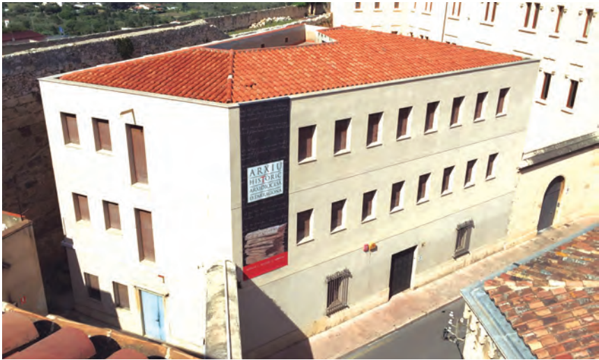
Façana de l'AHAT

La llarga ocupació militar (1939-1940) va impedir el restabliment de les antigues sèries documentals. Encara es tardaria uns quants anys a retrobar la documentació i a refer l'antiga organització. Mentrestant va ser creada una única sèrie de notaria de l'arquebisbat, sota la cura del Vicariat Eclesiàstic, i la documentació de Secretaria de Cambra i Govern va iniciar un llarg periple d'empobriment arxivístic i desorganització.